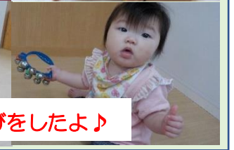
楽器あそびをしたよ♪